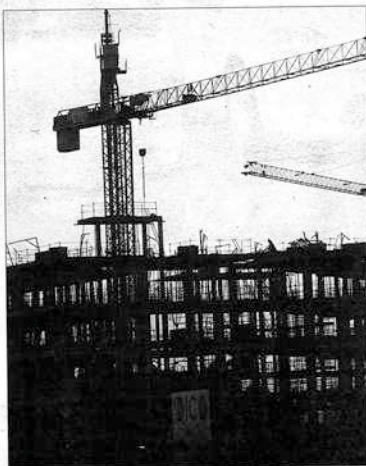
Las viviendas visadas cayeron especialmente en la segunda mitad del año.

En número, las viviendas visadas (que se pueden consultar en la página web del Colegio de Arquitectos de Ciudad Real: www.ccaarquitectos.com ) pasaron de las 12.414 de 2007 a las 6.544 del año pasado